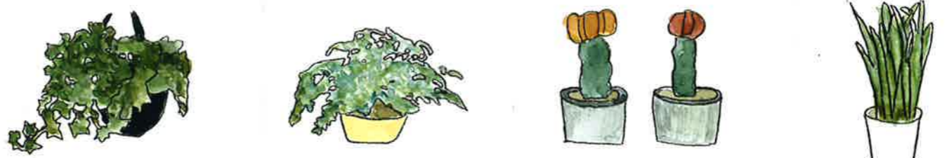
アイビー アジアンタム サボテン サンベリア